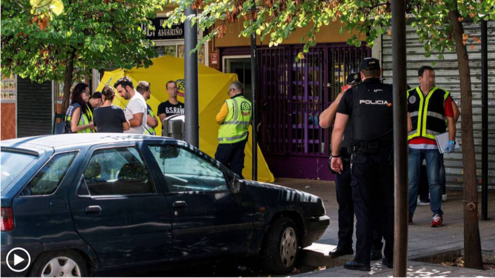
Samur y policía, a las puertas de la peluquería del distrito madrileño de Villaverde donde se ha cometido el crimen. En vídeo, declaraciones del portavoz de Emergencias.